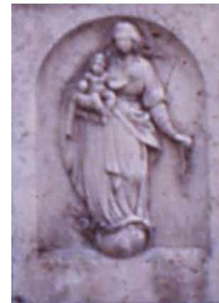
Foto del bassorilievo della Madonna del Rosario andato distrutto