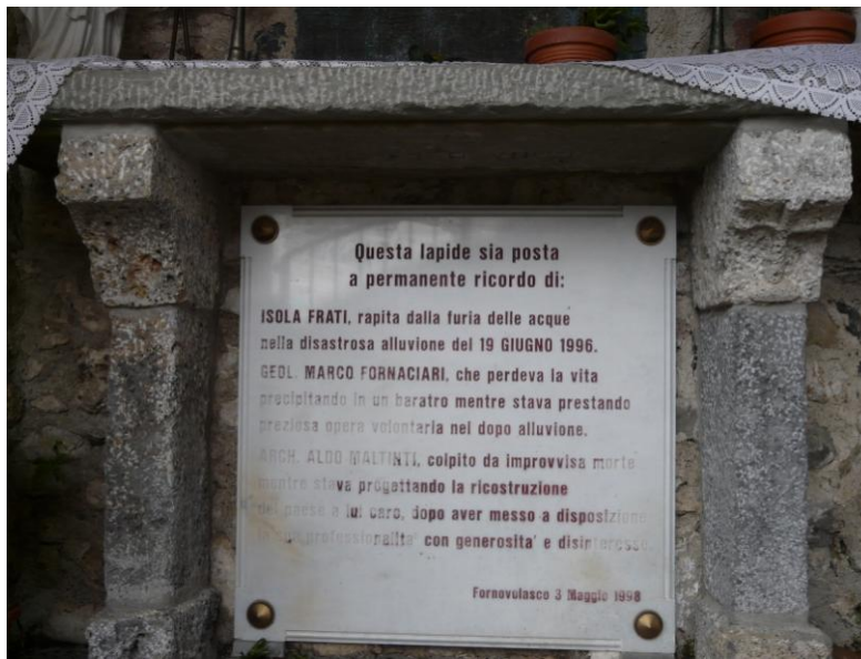
La lapide in memoria delle vittime dell'alluvione del 1996