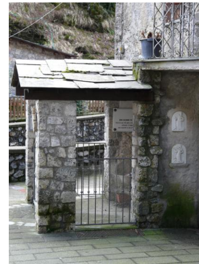
La Marginetta lato via per Petrosiana