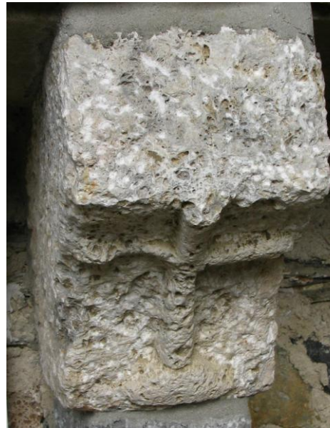
La croce in pietra in rilievo sotto l'altare