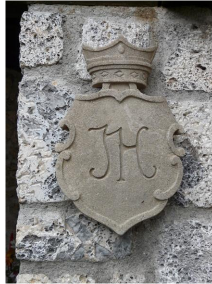
Lo stemma con il monogramma