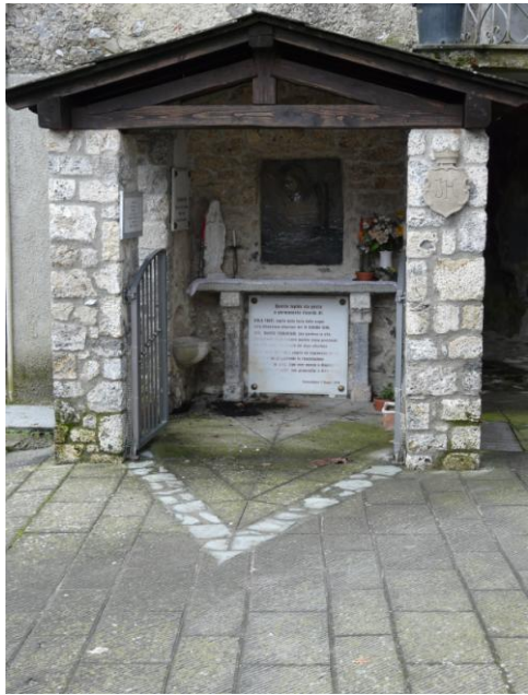
La Marginetta nel complesso