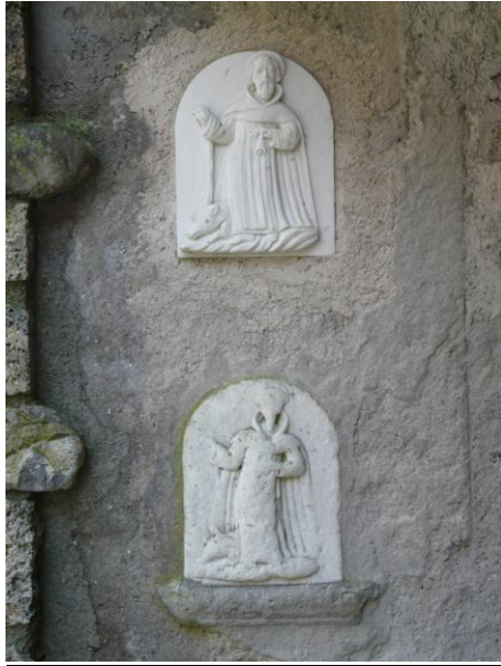
Il vecchio ed il nuovo bassorilievo dedicati a Sant'Antonio Abate