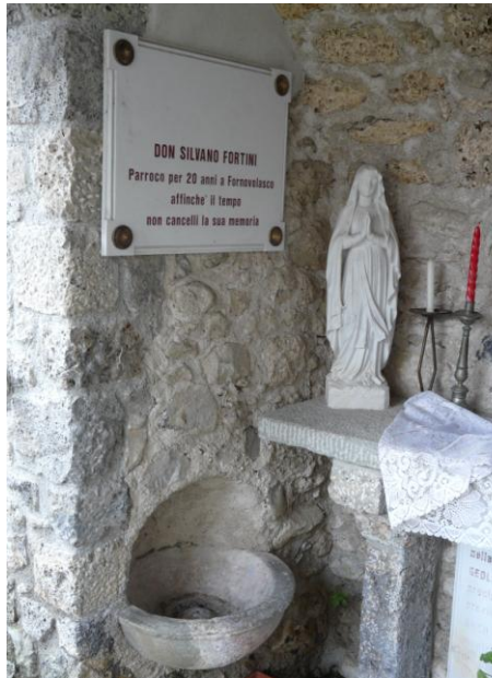
Il lato sinistro con acquasantiera e Madonna