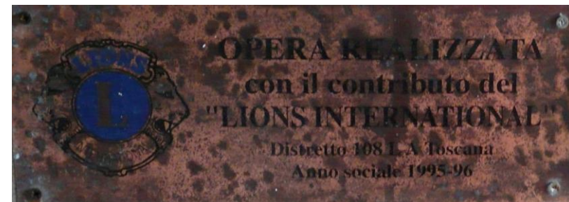
La targa del Lions International